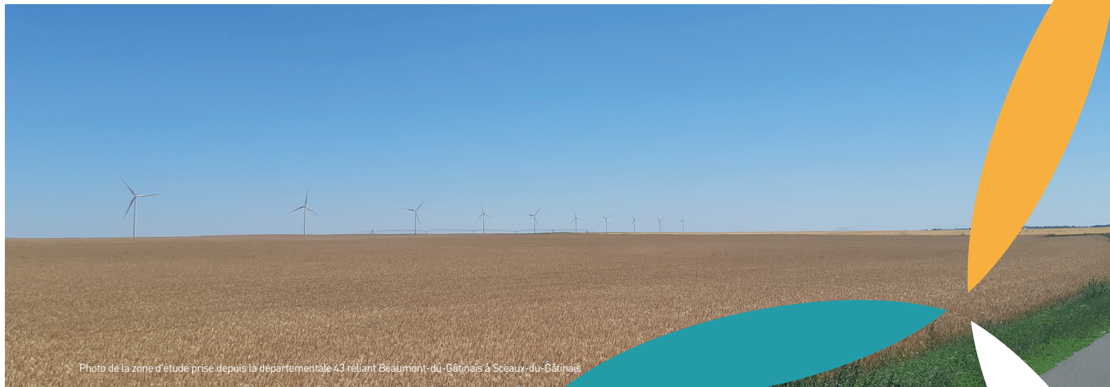
Photo de la zone d'étude prise depuis la départementale 43 reliant Beaumont-du-Gâtinais à Sceaux-du-Gâtinais

1100 MW raccordés en Centre-Val de Loire